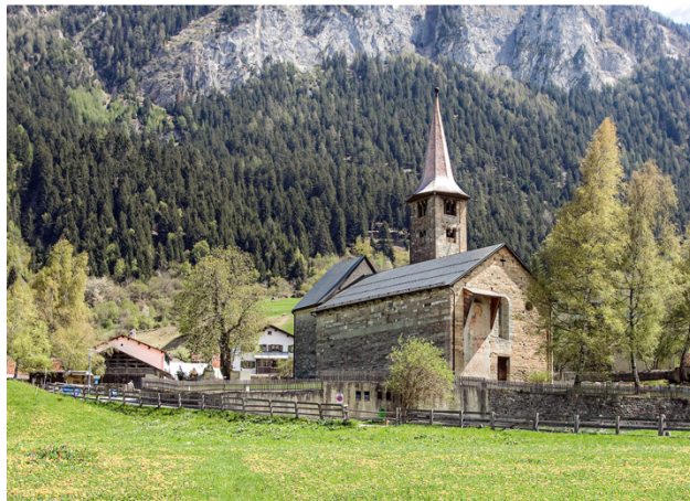
Kirche St. Martin Zillis

reformierte kirche knonauer amt aegst affoltern bonstetten hausen hedingen maschwanden mettmenstetten ottenbach rifferswil